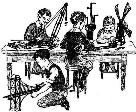
AU CLUB MECCANO. UN GROUPE AFFAÏRÉ