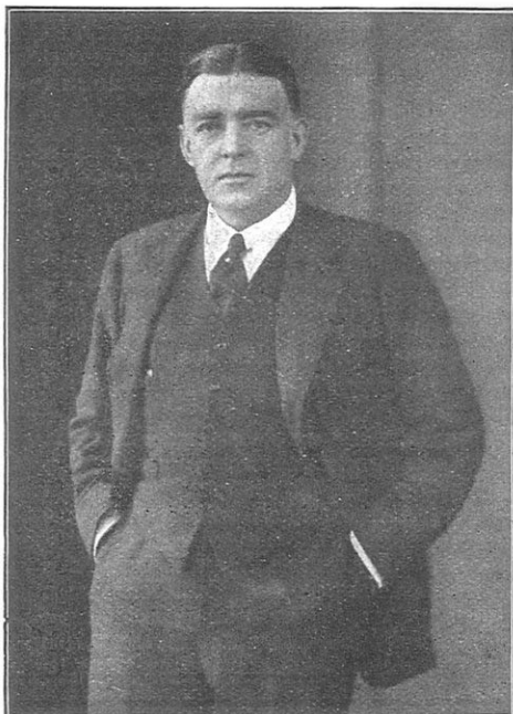
Sir Ernest SHACKLETON

Il n'est pas un seul de nos jeunes Meccanos qui n'ait appris avec un profond regret la mort de Sir Ernest Shackleton décédé le 5 Janvier dernier d'un arrêt du cœur. Il a succombé à bord de son navire le « Quest » au large de la Géorgie Méridionale en route pour l'Antarctique, où il conduisait l'expédition d'exploration Shackleton-Rowett dont il avait le commandement.